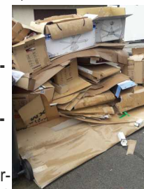
Viel zu viel für die Abfuhr! Solche Mengen werden nicht mitgenommen

Oft sind die Tonnen mit nur einem oder zwei großen Kartons befüllt und weitere Kartons liegen zur Abfuhr neben den Tonnen. Diese hätten bei entsprechender Zerkleinerung noch problemlos in das Müllgefäß gepasst und werden deshalb bei der Abfuhr der Blauen Tonnen nicht mitgenommen .